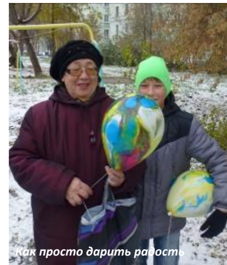
Как просто дарить радость