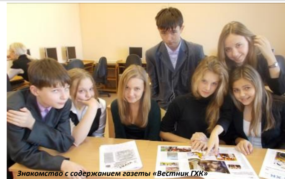
Знакомство с содержанием газеты «Вестник ГХК»

Опытные журналисты мечтают показать одаренным детям Железногорска, как просто и интересно писать статьи, брать интервью, формировать посты в блогосфере. Занятия предполагают анализ профильных интересов учащихся, встречи с о специалистами в области различных направлений деятельности