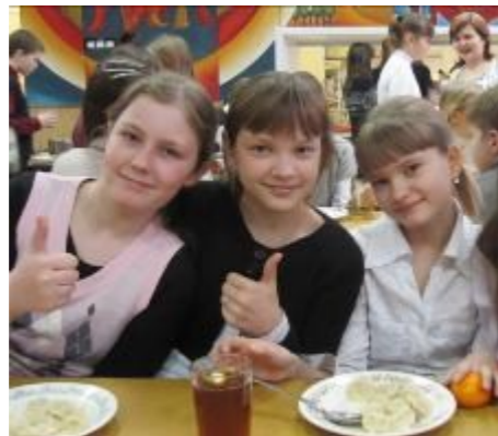
7б на обеде