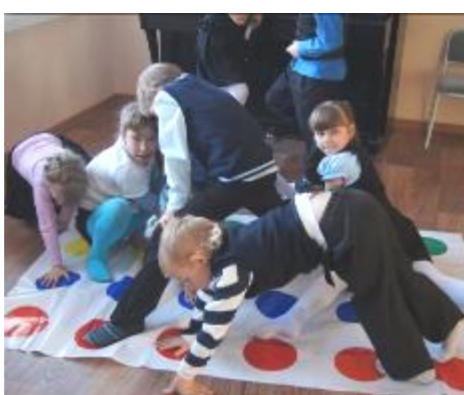
2в на перемене