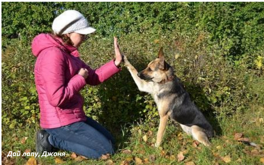
Дай лапу, Джоня

Джони, так назвали малышку, оказалась ласковой, жизнерадостной и очень смысленной. Она быстро подружилась с другими собаками, занимающимися в объединении – милашками-йорками, пуделями-непоседами, кра-