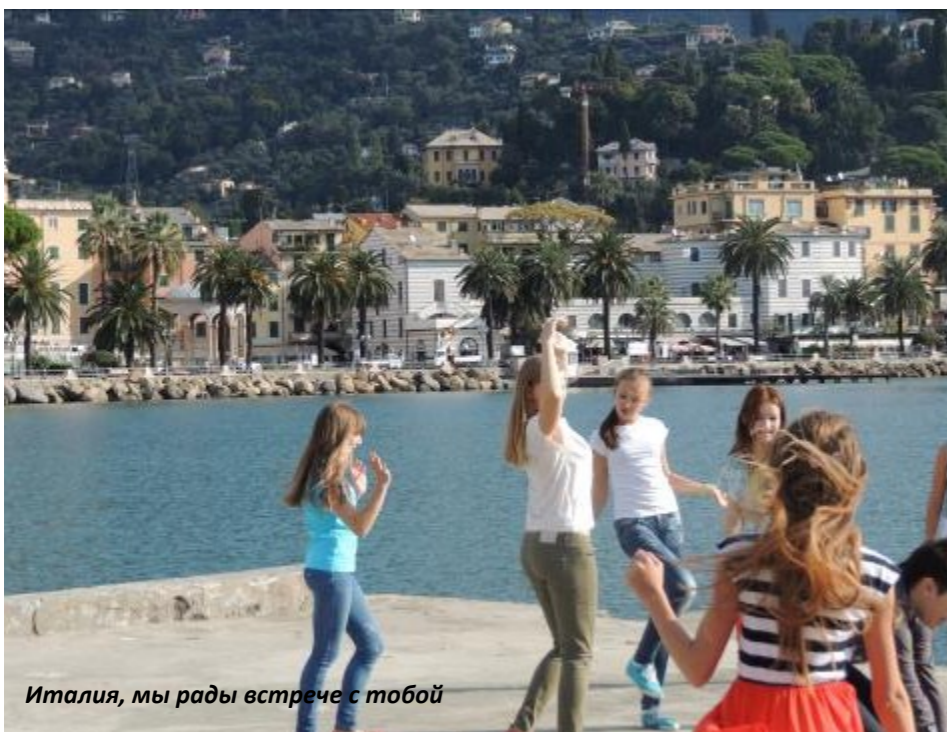
Италия, мы рады встрече с тобой