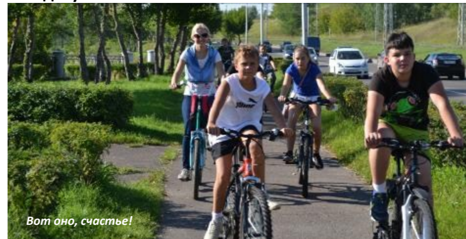
Вот оно, счастье!

В 7Б классе появилась ещё одна традиция – велопогулка. Все вместе друг за другом с горы в гору... Здорово! Весело! Дружно!