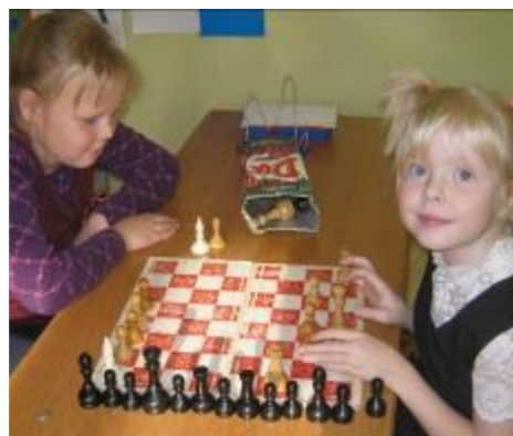
Шах и мат