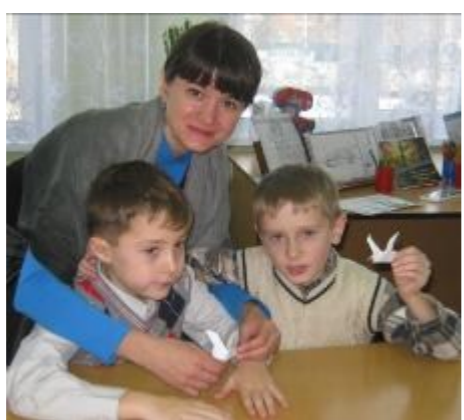
Сделали сами своими руками