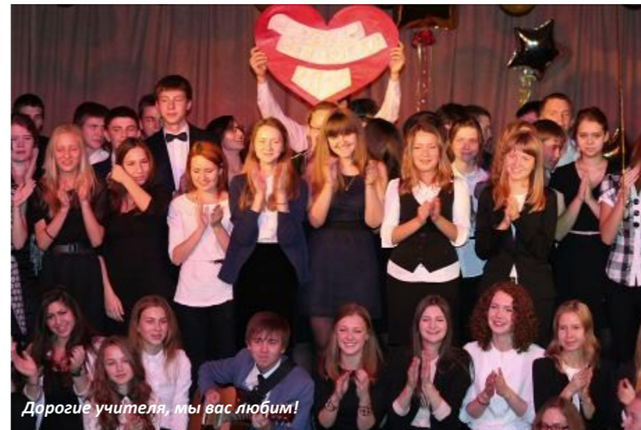
Дорогие учителя, мы вас любим!