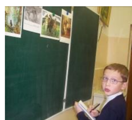
Приобщение к прекрасному