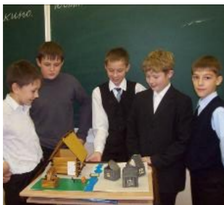
Юные архитекторы из 5б