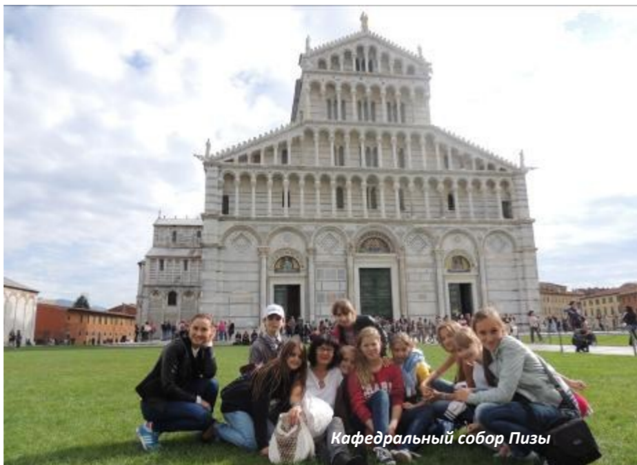
Кафедральный собор Пизы

ко, как хотелось бы. На первом конкурсном отборе сломалась аппаратура, во время выступления на городской площади поднялся жуткий шторм, голоса артистов не было слышно из-за ветра, и к концу 20-минутного номера на сцене практически не осталось реkvизита - стулья, шляпы, уши, деньги ураган унес в толпу зрителей. Также препятствием послужили козни конкурентов - одну из артисток другой коллектив закрыл в гримерке перед самым выходом на сцену. Но девочка не растерялась и вылезла через окно теат-