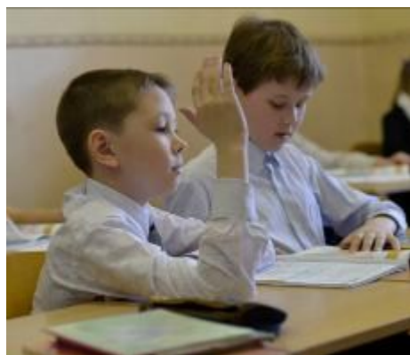
Женя готов к ответу