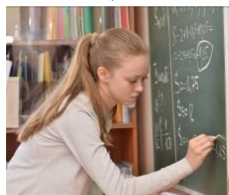
У Насти всё получилось