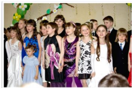
Гимназические балы в начальной школе