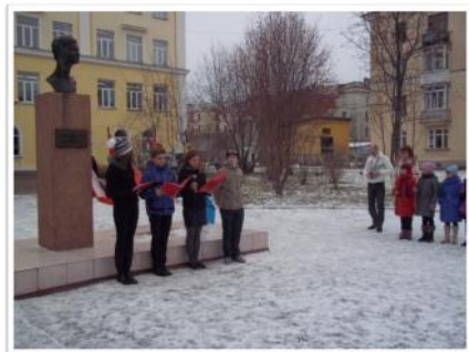
Линейка, посвященная памяти герою Советского Союза Зои Космодемьянской