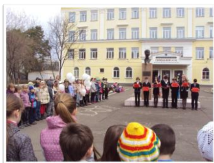
Линейка, посвященная Дню Победы