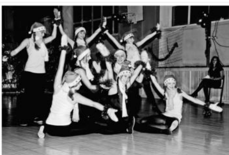
Спортивный праздник-соревнования по аэробике в среднем звене