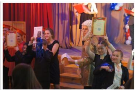
Посвящение в ломоносовцы