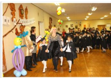
Посвящение в гимназисты