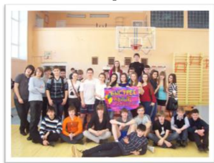
Военно-спортивная эстафета 10-11 классов